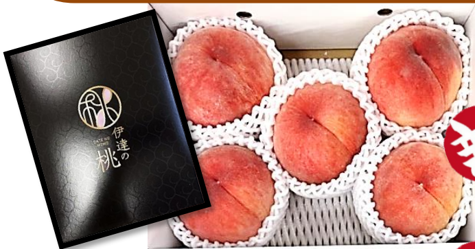
写真は、品番①のイメージです。